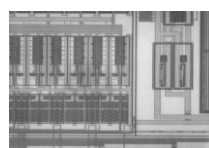
半導体ウエハー赤外顕微鏡検査