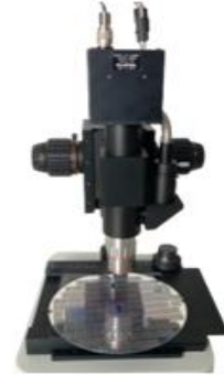
ローコスト IRマイクロSCOOP